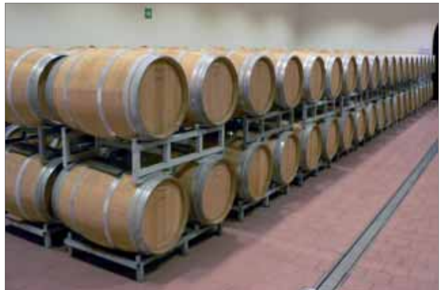
Wo Winzerherzen höher schlagen: der Weinkeller vom Weingut Plozzo.

Umso erfreulicher war, dass wir die Überraschung geniessen konnten von Aion bei San Carlo eine alte Mühle und eine Einführung in den neu gegründeten «Lehrpfad zur Entdeckung des Geschmacks der Geschichte» von Nicole Fanconi erhielten. Wir waren allesamt beeindruckt vom Schmied der uns das alte Handwerk des Schmiedes vorführte und mit wenigen beeindruckenden Handgriffen ein Hufeisen hervorzauberte. Nicht minder staunten wir, wie er uns die alte Säge – nur mit Wasser angetrieben - vorführte, einmalig und faszinierend die Abläufe der Mechanik die im 18. Jahrhundert entstanden ist und heute noch funktioniert. Man muss sich unweigerlich die Frage stellen, was ist heute im 21. Jahrhundert anders. Ausser, dass alles elektronisch funktioniert und auf den 1000 eingestellt gemessen wird. Die Basis aber ist nach wie vor der Pioniergeist und das praktische Denken des 18. Jahrhunderts. Valposchiavo bot uns gleich zu Beginn eine angenehme Überraschung auf der Südachse Basel – Zürich – Milano. Die abschliessende Vorführung der alten Mühle – auch mit Wasserkraft - betrieben liess uns