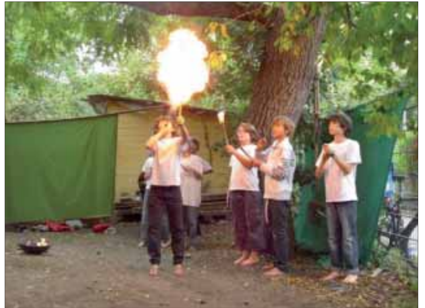
Sah gefährlich aus: Feuerspeihende Robikinder

Dieses Robifest wird in die Geschichte unseres Platzes eingehen, wir danken darum den sehr treuen Freunden des Robis: der Gärtnerei Senn für die vielen schönen Blumen, Noccito Santitär, der BirsigBuchhandlung, Viva Gartenbau und zwei netten Schwestern für das Sponsoring der Musik «des Dudels Kern - sackstarke Volksmusik» mit ihren tollen Dudelsäcken und anderen mittelalterlichen Instrumenten. Wir danken den Musikern, den Kindern an den Ständen (ihr ward auch sackstark!), den zahlreichen grossen Helferinnen und Helfern am Fest und den vielen, vielen Besuchern und Besucherinnen - ein gewaltiges Fest war das, vielen Dank! die Robileitung und der Vorstand