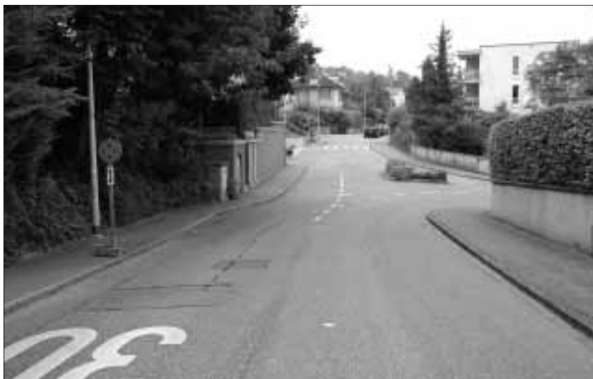
Verkehrsberuhigung Tempo-30-Zone Ost: Der Kreuzungsbereich Bruderholz-/Margarethenstrasse wird übersichtlicher gestaltet.

Aufgrund von Einwänden hat die Gemeinde die geplanten Verkehrsberuhigenden Massnahmen in der Tempo-30-Zone Ost auf dem Strassenzug Bruderholzstrasse–Margarethenstrasse–Bruderholzrain angepasst. In den kommenden Tagen werden diese provisorisch umgesetzt. Definitiv und kostengünstig erfolgt die Realisierung dann zusammen mit Werkleitungsarbeiten.