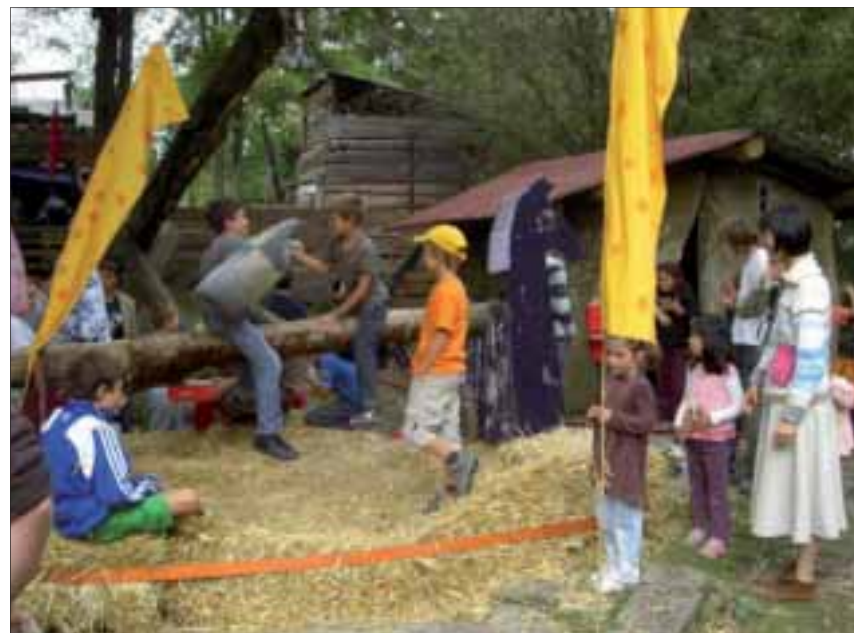
Für Mutige: Kämpfen wie im Mittelalter