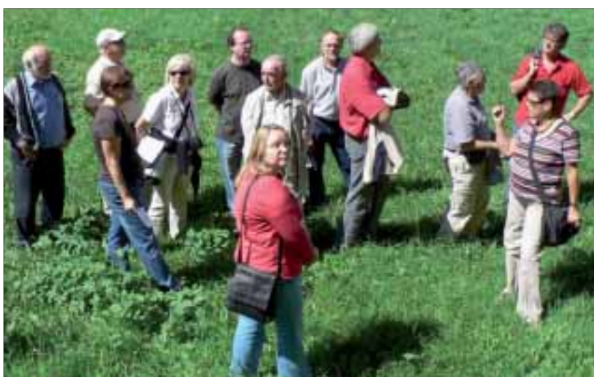
Winzer auf Weiterbildungsreise: nun schien zum Glück auch wieder die Sonne