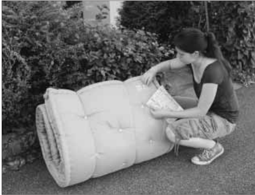
Kästen, Betten, Matratzen: Alles, was brennbar ist, darf bei der Sperrgutabfuhr mit. Gebührenmarke(n) nicht vergessen, sonst bleibt die Ware stehen.

Die Gräber müssen bis Ende Dezember 2009 abgeräumt sein. Erfolgt die Abräumung durch die Angehörigen nicht innert der angegebenen Frist, nimmt der Gemeinderat als Aufsichtsbehörde an, dass über die allenfalls noch vorhandenen Grabsteine, Anpflanzungen, etc. verfügt werden kann. Die Abräumung erfolgt in diesem Falle kostenlos durch das Friedhofspersonal der Gemeinde. Der Gemeinderat Auskunft erhalten Sie bei der Friedhofsgärtnerei oder bei der Gemeinde Binningen (Tel. 061 425 53 11).