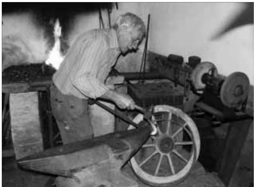
Nach altem Brauchtum: der Metallring um das Fass wird geformt.

Das Haus wurde von 4 Töchtern von Domenico Tomé bis 1992 bewohnt. Sie wohnten in Verhältnissen, die für uns als Besucher aus einer andern Zeit zu stammen scheinen. Ein Beispiel soll aufzeigen wie in diesem Haus gelebt wurde: In der viel genutzten Küche befindet sich ein alter Backofen dessen Volumen aus Raumnot nach aussen an der Fassade angehängt wurde, daneben steht ein Holzofen aus dem Jahre 1920, gleich daneben ein neuerer Holzofenherd aus den 50-er Jahren und wohl ab 1970 ein elektrischer Herd, der an die einzige Leitung angeschlossen wurde.