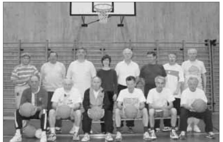
Aktivriege mit Fitnesstrainerin in der Spiegelfeldturnhalle

Der Turnverein Binningen wurde im Jahre 1866 gegründet. Der einst grosse und erfolgreiche Verein mit vielen Kranzturnern und unzähligen Turnfestsiegen im Kanton und Bezirk hat sich im Laufe der vergangenen Jahre gewandelt. Heute zählt der Verein immer noch stattliche 120 Mitglieder. Die Aktivitäten allerdings haben sich verändert. Nachdem keine Kunstturnerriege mehr besteht und die Leichtathleten-