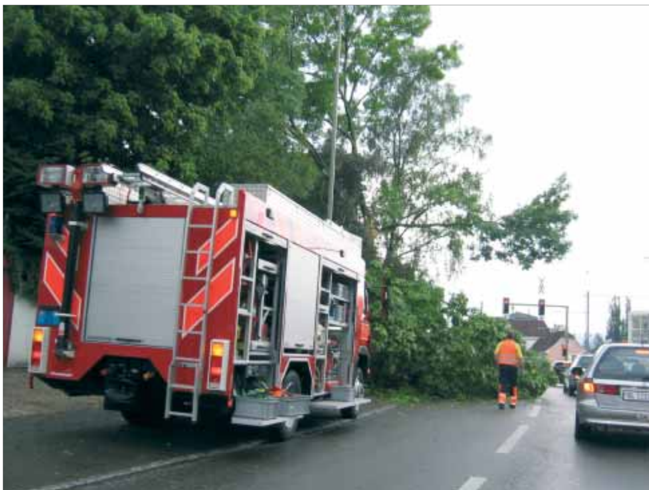
Die Feuerwehr Binningen im Einsatz: Stück für Stück wird der Baum zersägt und zum Abtransport gerichtet.

Die Pikettendienste der IWB konnten den Schaden an den Pumpen in Allschwil rasch beheben, die Lokalisierung des anschliessenden Wasserleitungsbruchs in der Hölzlistrasse war aufgrund der heftigen Niederschläge schwierig, da der Rohrleitungsbruch