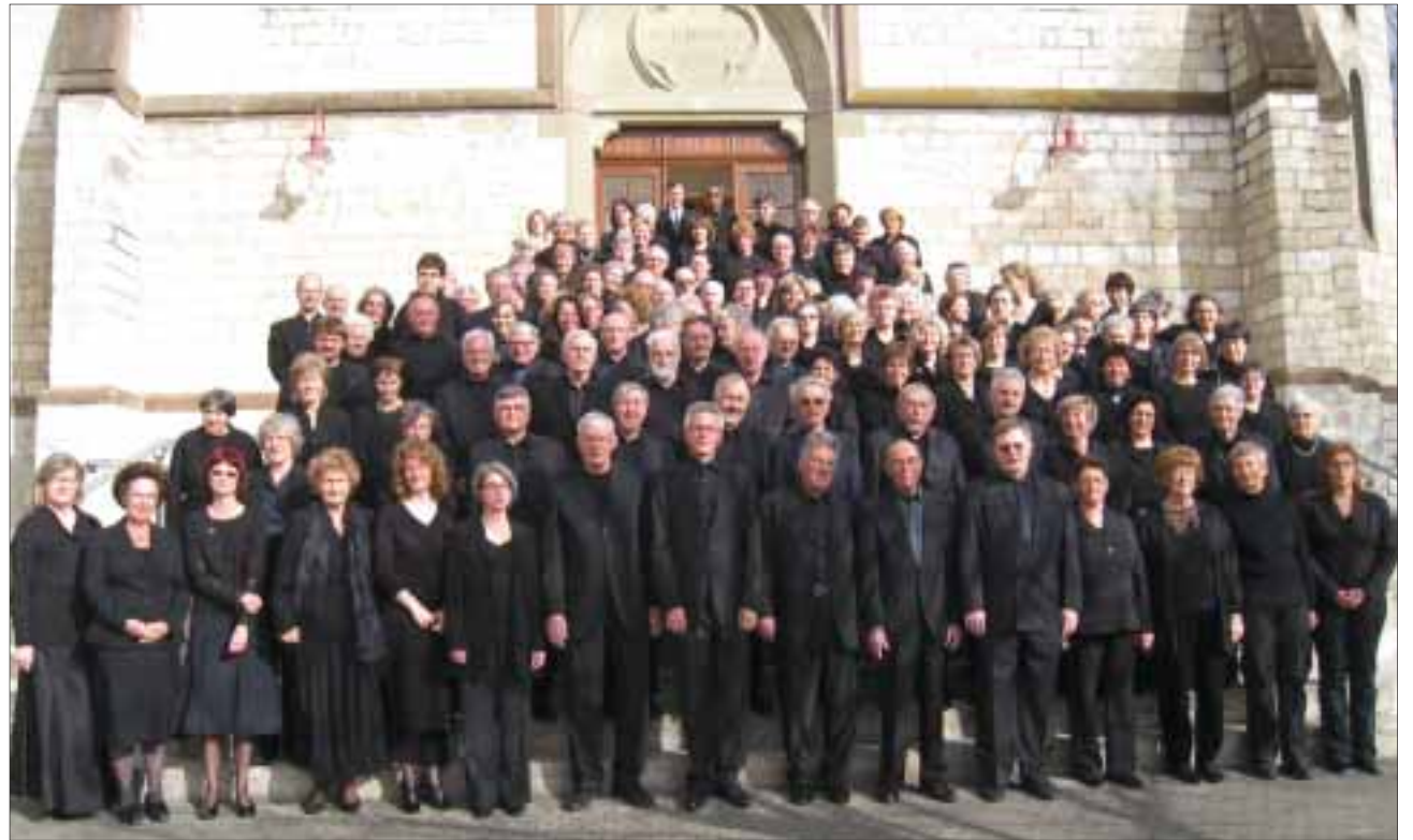
Osterkonzert: Mit über 150 Mitwirkenden aus der Metallharmonie, der Musikschule, dem verstärktem Orchester Binningen und den vereinigten Chören von Binningen.

In der katholischen Kirche boten die Metallharmonie, das verstärkte Orchester, die Musikschule und die vereinigten Chöre von Binningen am vergangenen Wochenende ein glanzvolles Konzert. Beide Aufführungen waren ein Erfolg und das Publikum begeistert. Für die Mitwirkenden ging ein wunderbares Gemeinschaftserlebnis in Erfüllung.