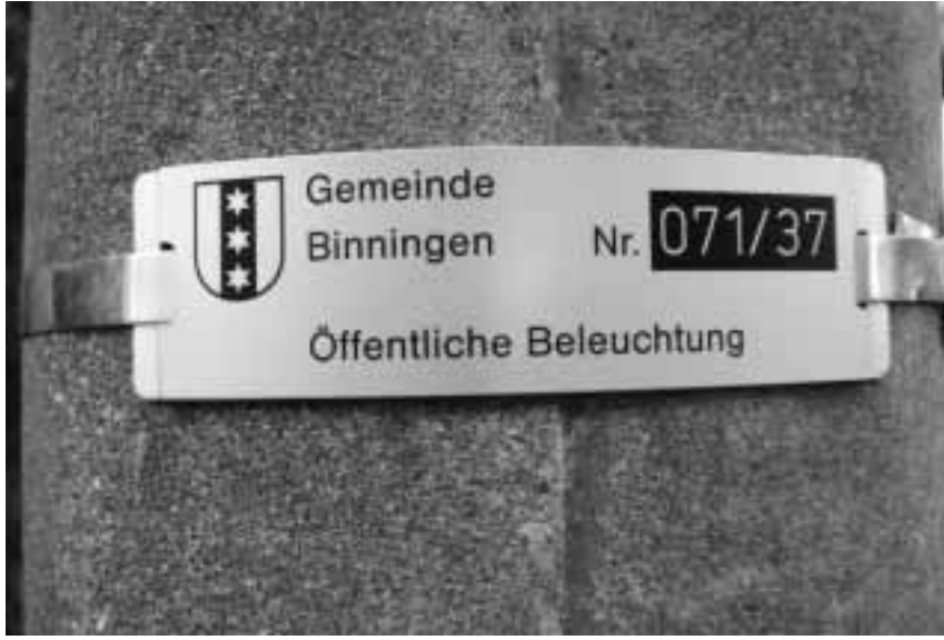
Die Strassenlampen sind gekennzeichnet: Die Nummer 071 steht in diesem Beispiel für Margarethenstrasse, 37 für Kandelaber Nr. 37.

Die Gemeinde Binningen verfügt über ein technisch gut ausgebautes Strassenbeleuchtungsnetz. Bei den insgesamt 1680 Leuchten gibt es immer wieder Lampenausfälle (Glühbirne defekt) oder seltene Netzstörungen. Der Werkhof kontrolliert die Leuchten zirka alle drei Wochen. Dank der Mithilfe der Bevölkerung ist eine beschleunigte Schadensbehebung möglich. Wir sind deshalb froh, wenn Sie uns Ihre Beobachtung melden.