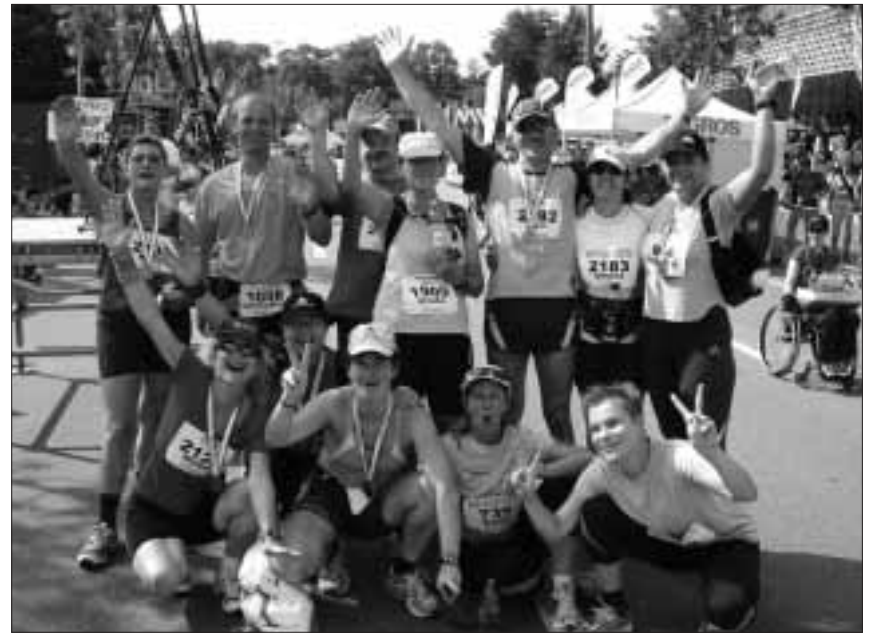
Der Verein Laufbewegung Regio Basel bietet Lauftrainings für Einsteiger und Fortgeschrittene an. Damit der Spass am Laufen lange währt.

Der Verein mit Sitz in Binningen will mit seinem Trainingsangebot vor allem eines: Die Läufer vor Überforderung schützen, diese zum gesunden Ausdauersport motivieren und sie in abwechslungsreichen Gruppentrainings an ihre persönlichen Ziele heranzuführen. Viele wollen schnell zum Ziel kommen, wählen demzufolge falsche Trainingseinheiten oder ein zu hohes Tempo.